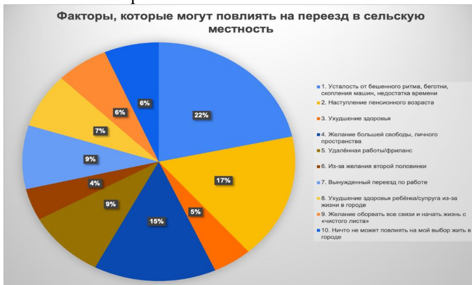
Рисунок 2 – Факторы, которые могут повлиять на принятие решения о переезде в сельскую местность

На Рисунке 2 можно увидеть факторы, выделяемые опрошенными в качестве стимулирующих горожан к переезду на постоянное место жительства в сельскую местность. Основной мотив, способный оказать влияние на переезд в село у опрошенных, это усталость от бешеного ритма городской жизни, недостатка времени и скопления машин, так отметили 22 % опрошенных. На втором месте по значимости это наступление пенсионного возраста (17 %). Возможно, это связано с желанием провести оставшуюся жизнь в более спокойной обстановке, ближе к природе. Другие факторы, такие как желание большей свободы и личного пространства (15 %), вынужденный переезд по работе (9 %), удаленная работа / фриланс (9 %), ухудшение здоровья ребенка /супруга из-за жизни в городе (7 %), желание оборвать все связи и начать жизнь с чистого листа (6 %), ухудшение здоровья (5 %), а также из за желания второй половинки (4 %) также указаны как мотивы переезд в сельскую местность. Только 6 % респондентов считают невозможным свой переезд в сельскую местность, ни при каких условиях, что может быть связано с привязанностью к городской жизни или в силу сложившихся существующих негативных представлений о сельском образе жизни.