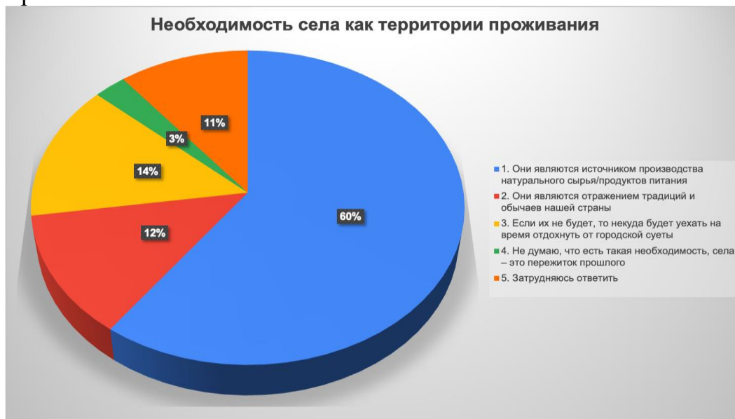
Рисунок 1 – Необходимость сохранения села как территории для проживания

В опросе было предложено продолжить высказывание «Необходимо поддерживать жизнь и развитие в селах, потому что...» с целью выявления отношения респондентов к сохранению села, как традиционной территории для проживания в России. Большинство опрошенных (60%) считают, что необходимо поддерживать жизнь и развитие в селах, так как они являются источником производства натурального сырья/продуктов питания, 12% отметили, что села отражают традиции и обычаи нашей страны, а 14% указали на тот факт, что без сел не будет места, куда можно уехать на время отдохнуть от городской суеты. Только 3% опрошенных не считают необходимым поддерживать жизнь и развитие в сельской местности, считая их пережитком прошлого, 11% респондентов затруднились ответить на этот вопрос (см.: Рисунок 1). Эти результаты могут указывать на то, что большинство опрошенных придают значение сохранению сельского мира и его уклада, традиций с ним связанных, выделяют роль сельской местности в экономике и культуре страны.